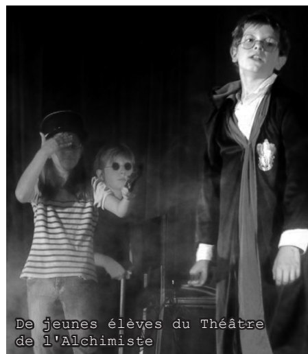
De jeunes élèves du Théâtre de l'Alchimiste