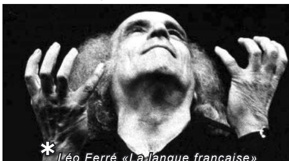
* Léo Ferré «La langue française»